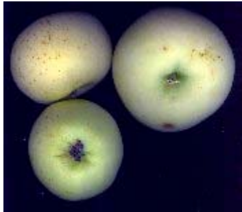
Vue et coupe Choisel jean-louis© 2007